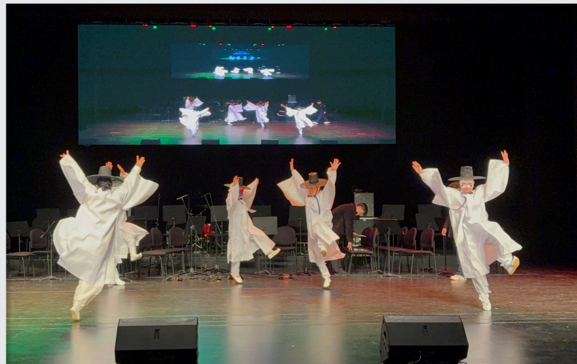
영덕문화예술교육축제 리허설 및 공연