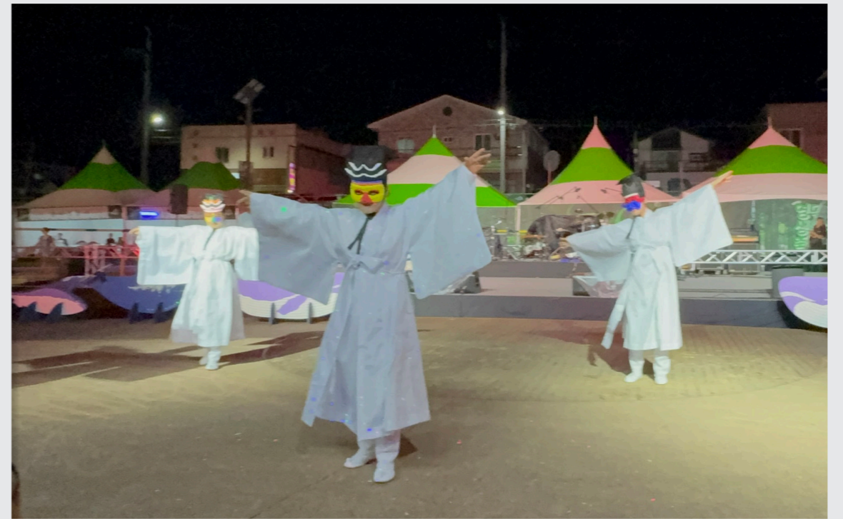
영덕생활문화축제 총연습 및 공연