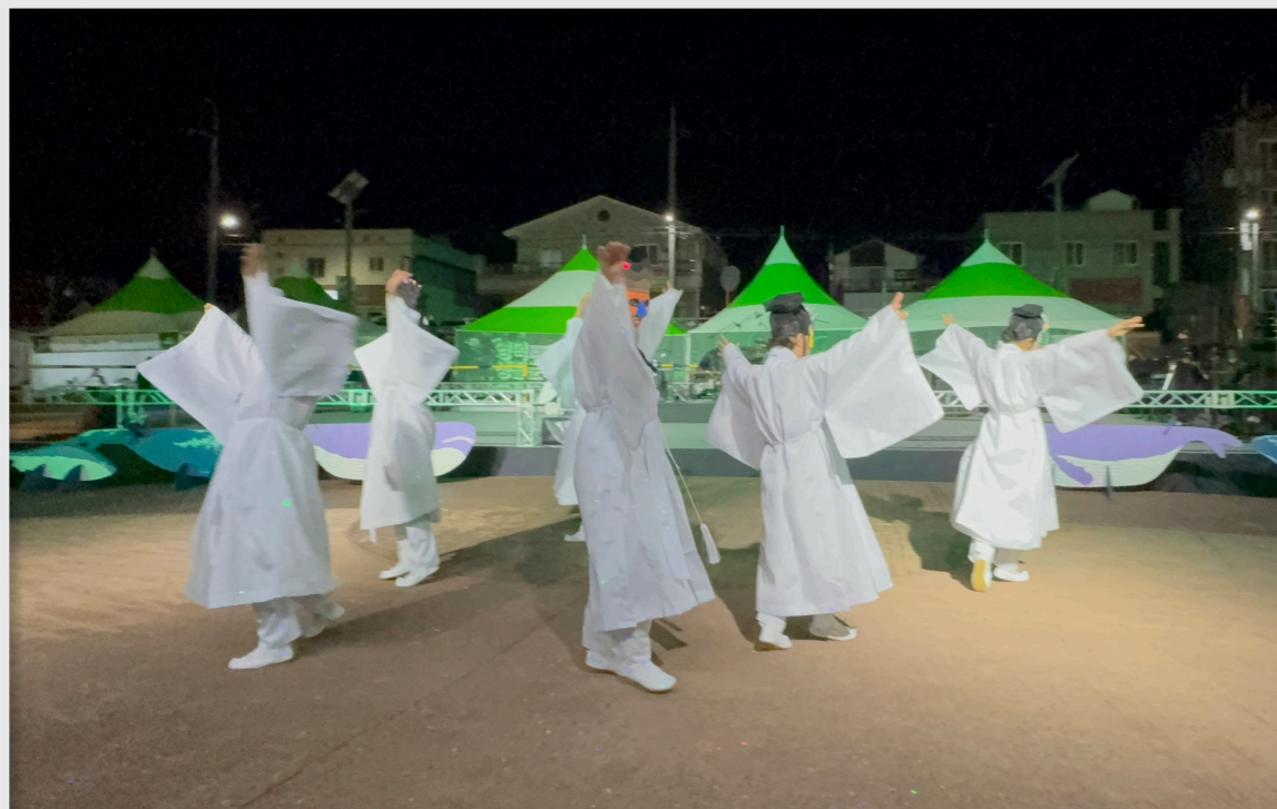
영덕생활문화축제 총연습 및 공연