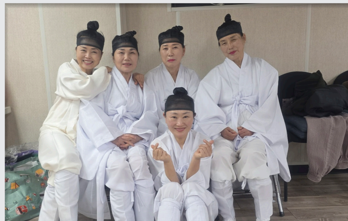
영덕문화예술교육축제 리허설 및 공연 / 성과 공유회