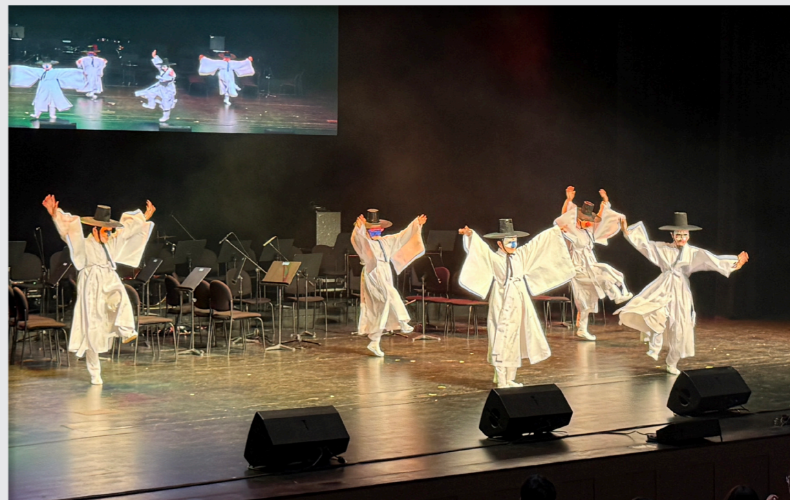
영덕문화예술교육축제 리허설 및 공연 / 성과 공유회