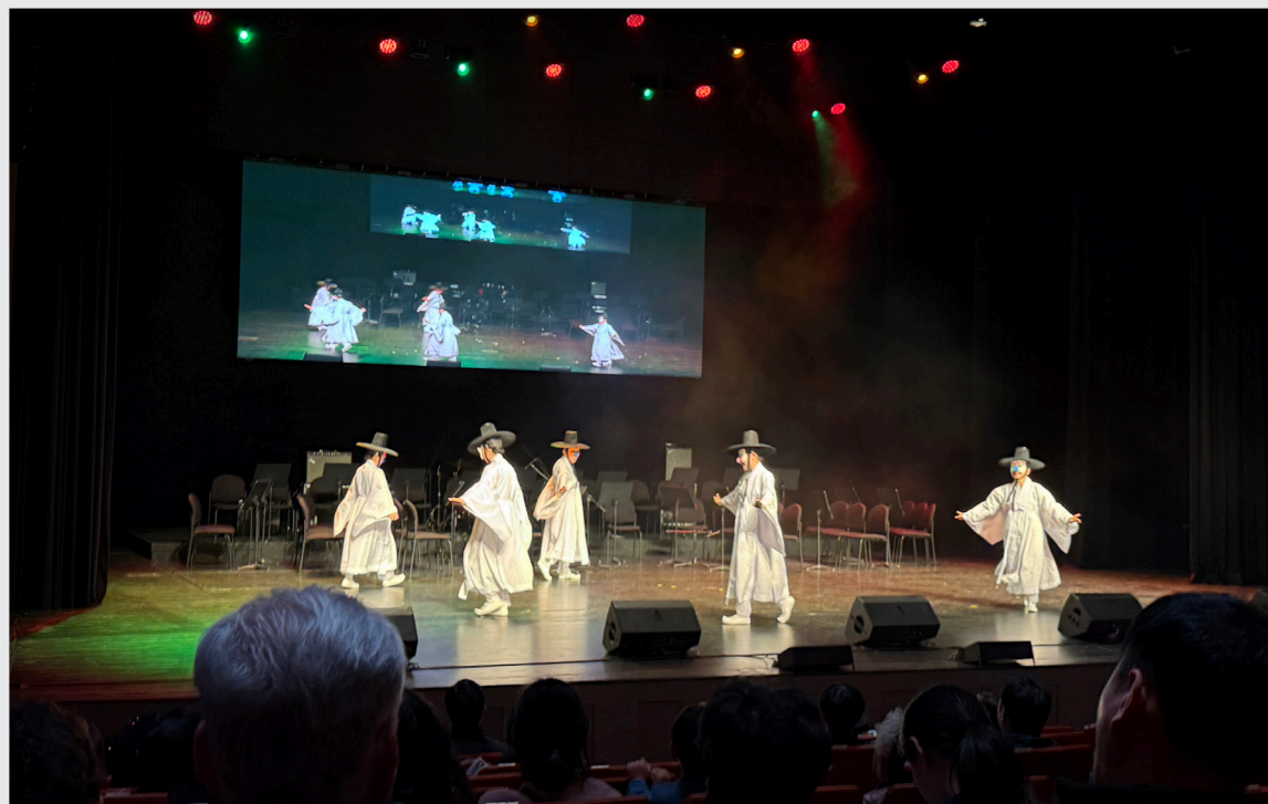
영덕문화예술교육축제 리허설 및 공연 / 성과 공유회