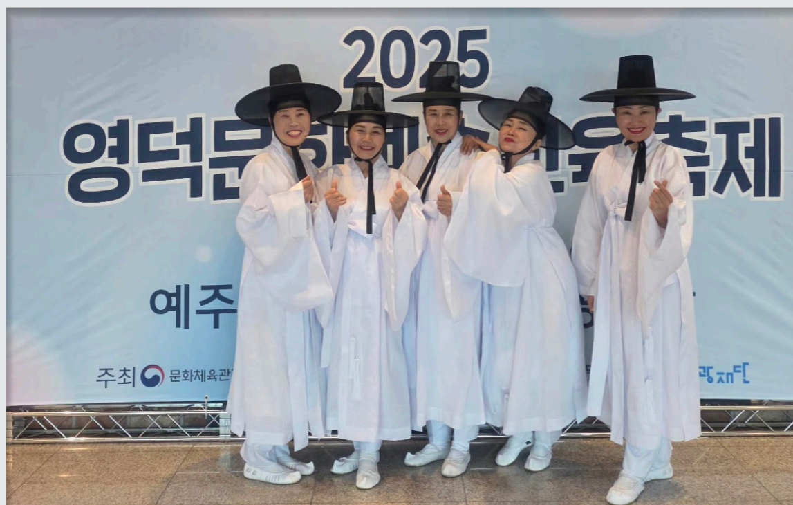
영덕문화예술교육축제 리허설 및 공연 / 성과 공유회