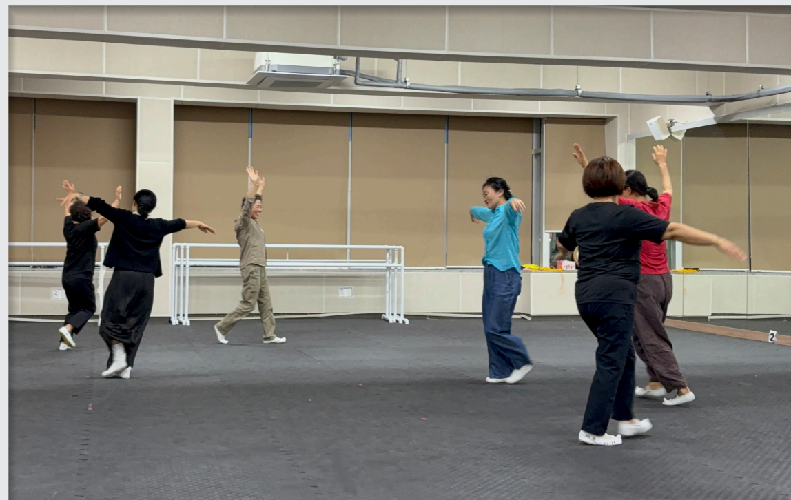
문화예술교육축제 공연 참가 작품 만들기