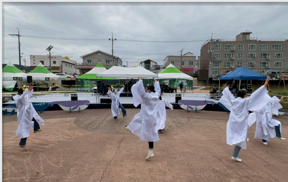
영덕생활문화축제 총연습 및 공연