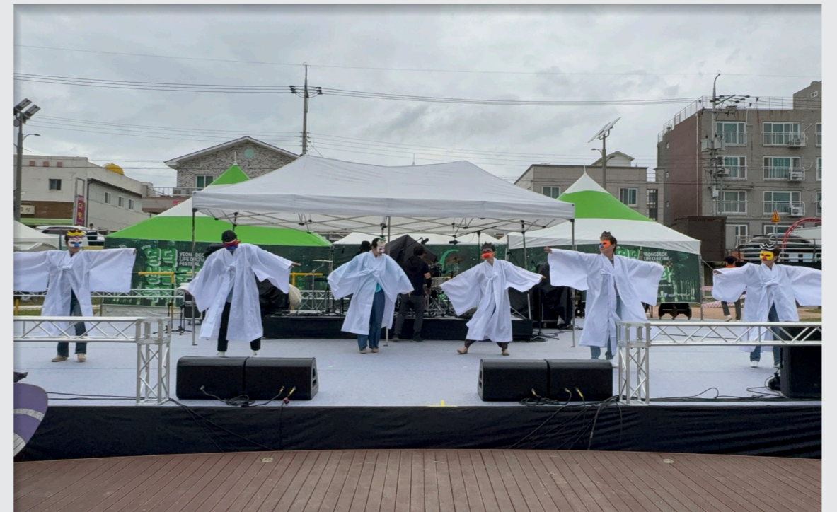
영덕생활문화축제 총연습 및 공연