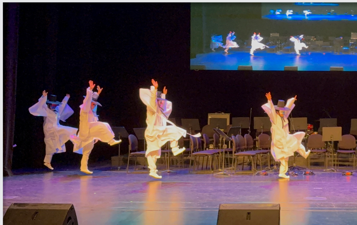
영덕문화예술교육축제 리허설 및 공연 / 성과 공유회