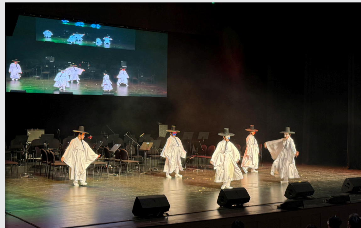
영덕문화예술교육축제 리허설 및 공연 / 성과 공유회