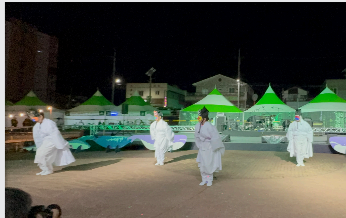
영덕생활문화축제 총연습 및 공연