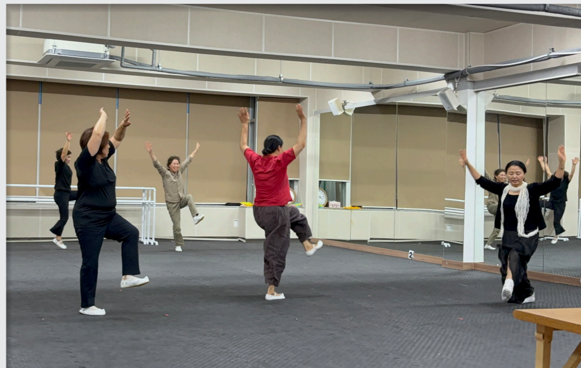
문화예술교육축제 공연 참가 작품 만들기