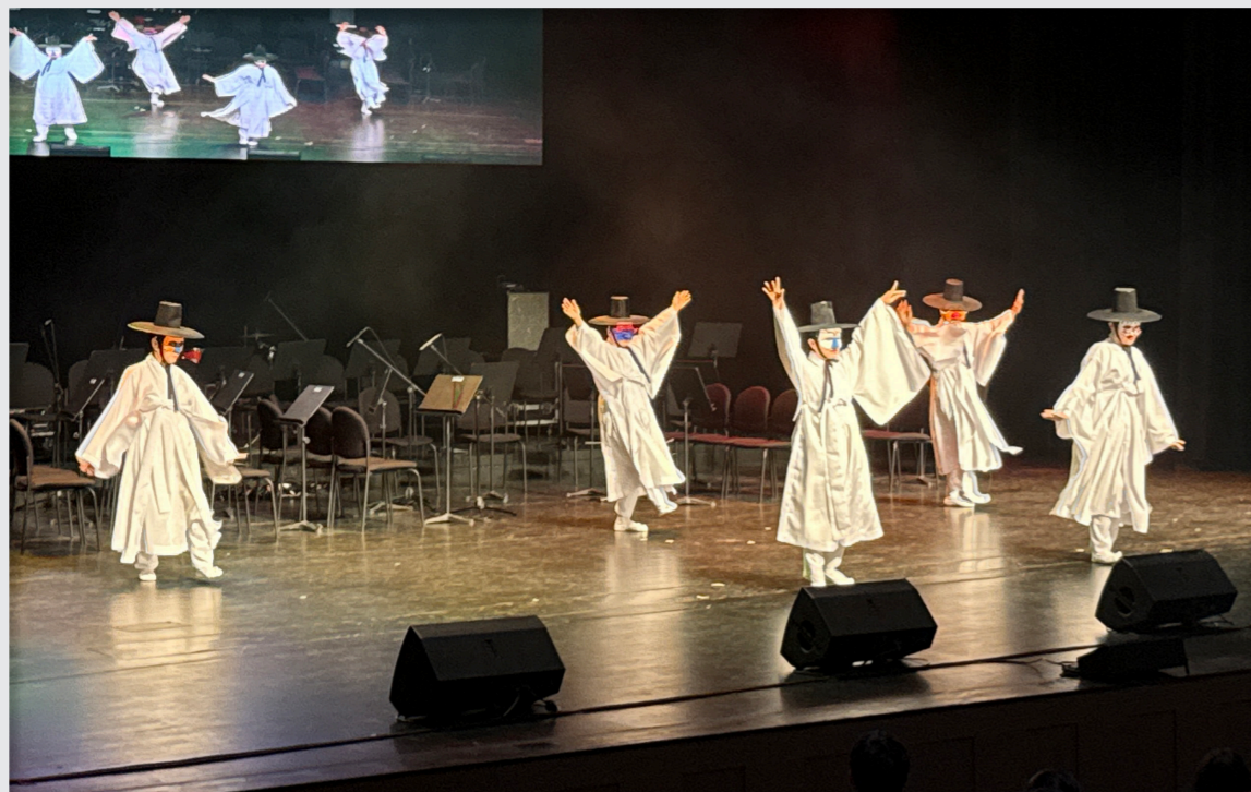
영덕문화예술교육축제 리허설 및 공연