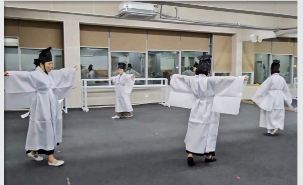
영덕생활문화축제 총연습 및 공연