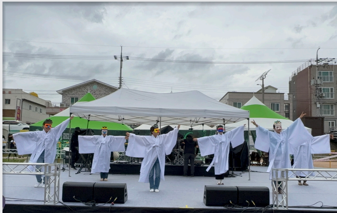
영덕생활문화축제 총연습 및 공연