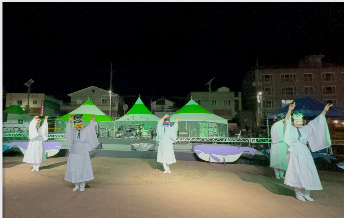
영덕생활문화축제 총연습 및 공연