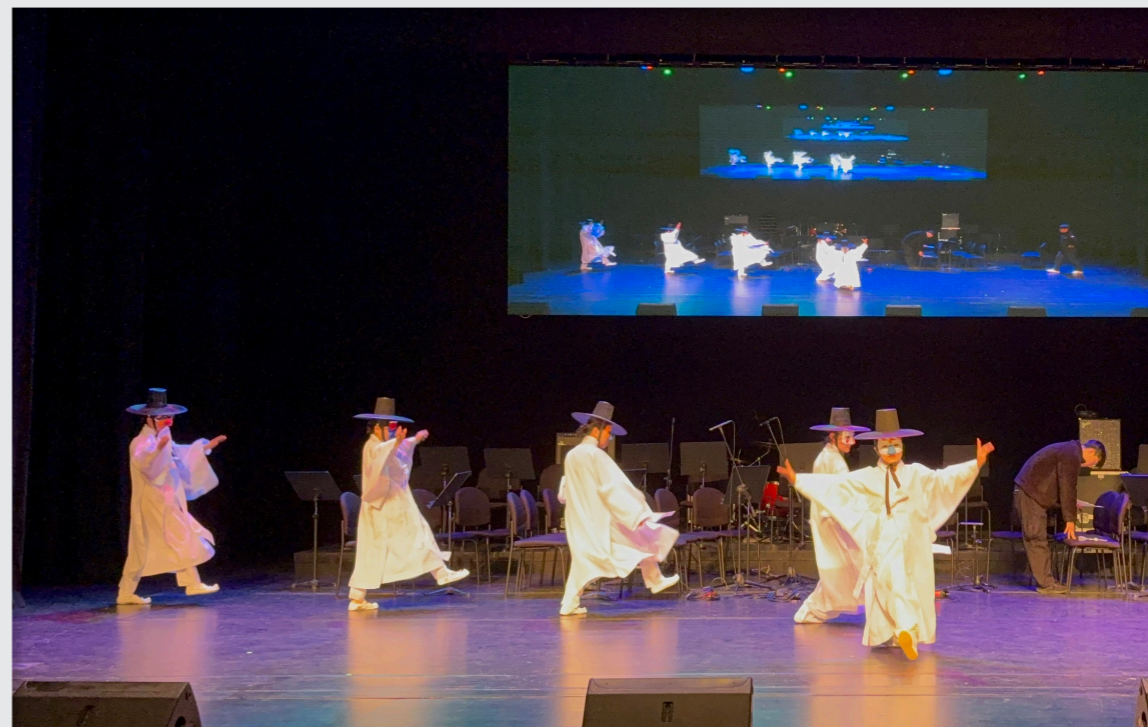
영덕문화예술교육축제 리허설 및 공연 / 성과 공유회