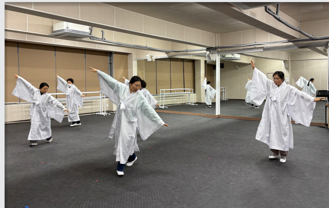
영덕문화예술교육축제 리허설 및 공연