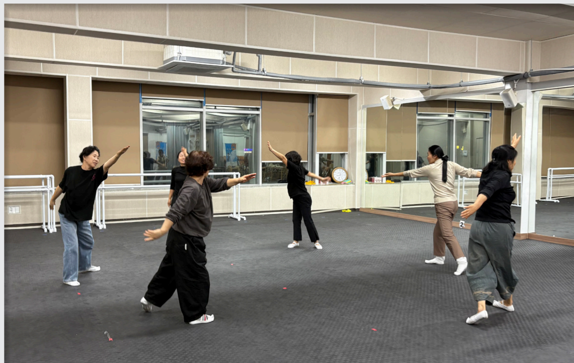
최종 반복 연습