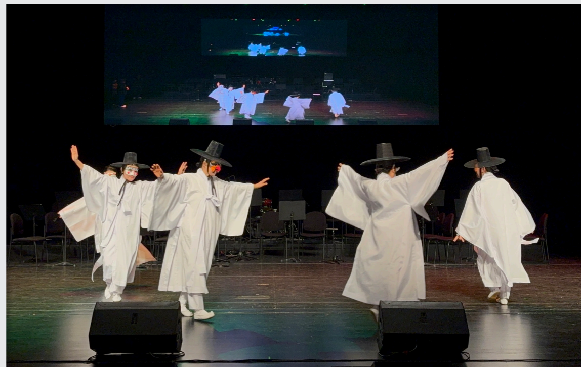
영덕문화예술교육축제 리허설 및 공연