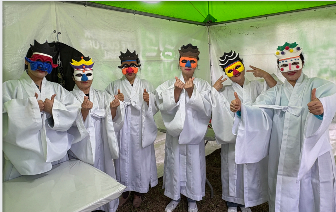
영덕생활문화축제 총연습 및 공연