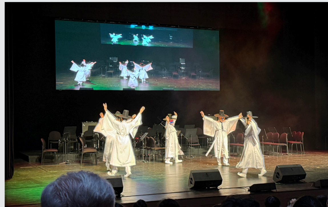
영덕문화예술교육축제 리허설 및 공연