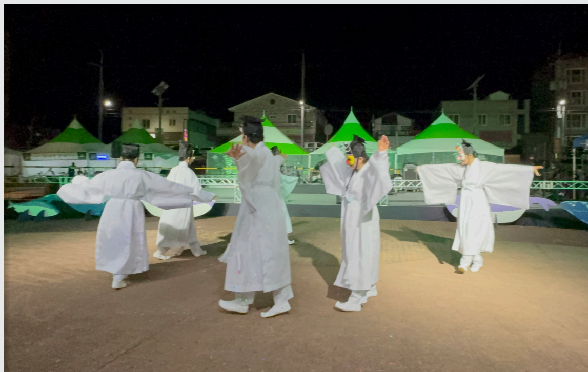
영덕생활문화축제 총연습 및 공연