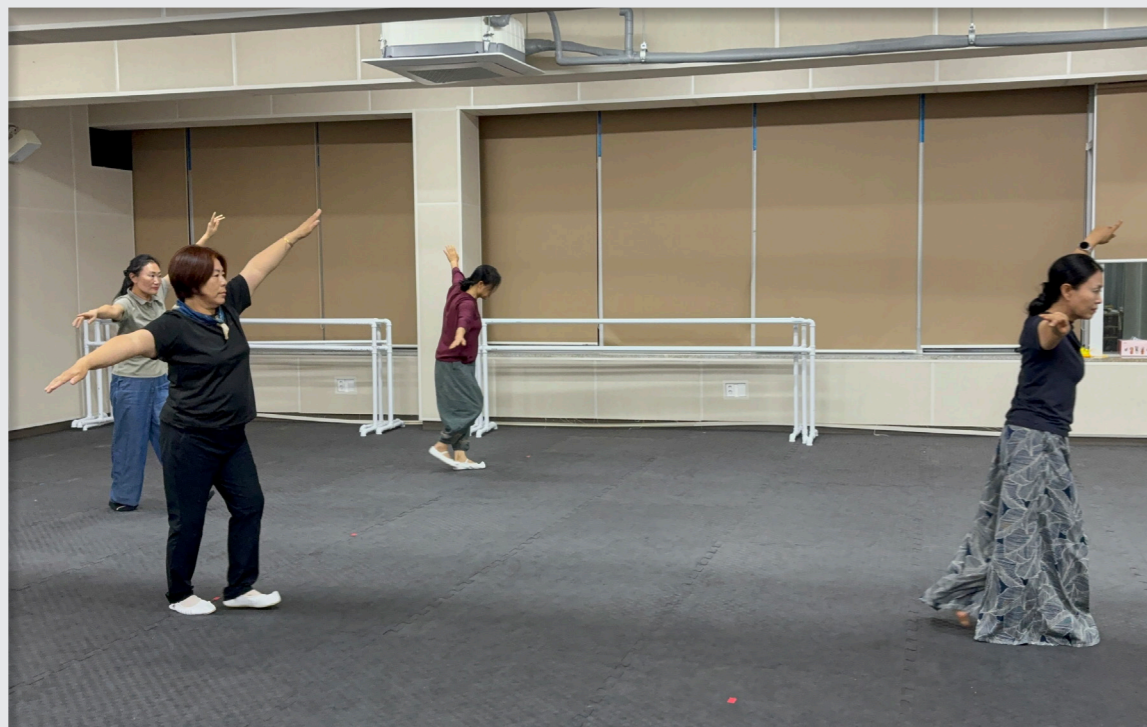
최종 반복 연습