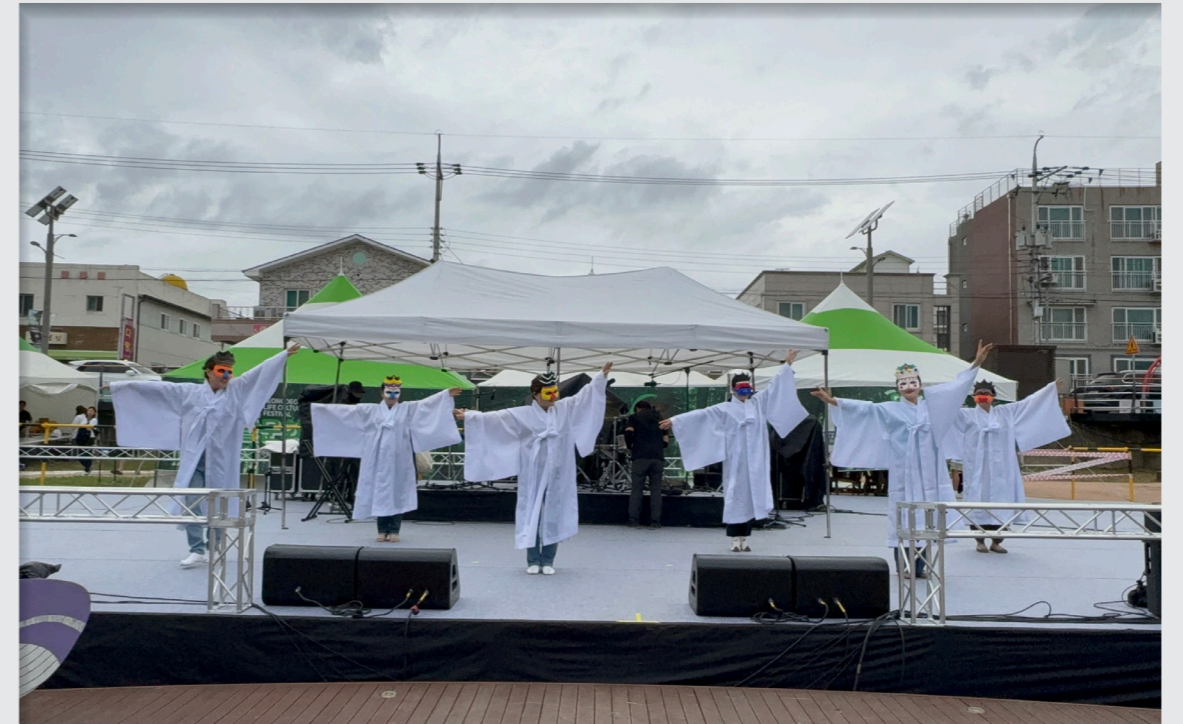
영덕생활문화축제 총연습 및 공연