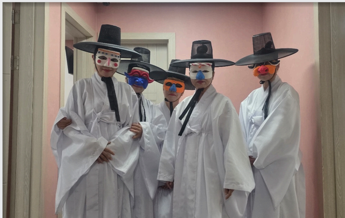
영덕문화예술교육축제 리허설 및 공연