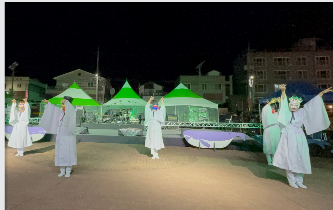
영덕생활문화축제 총연습 및 공연