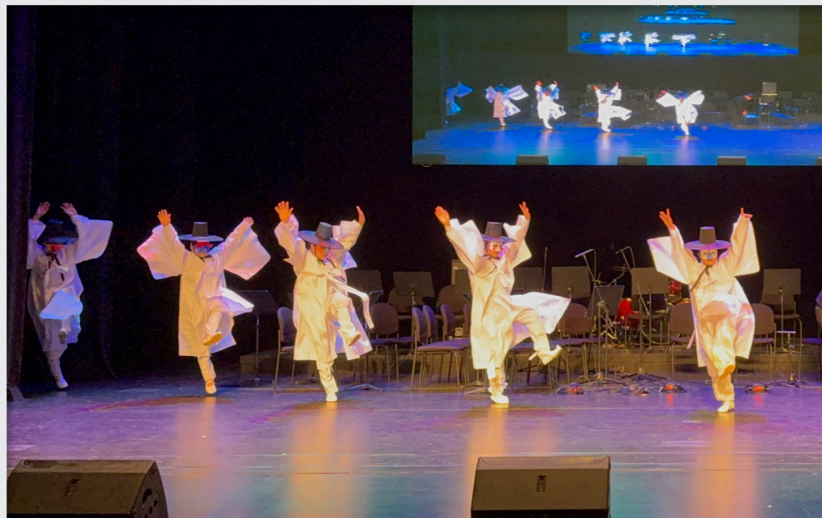
영덕문화예술교육축제 리허설 및 공연